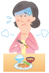
食べ物が飲み込みにくい