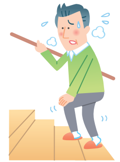
階段の上り下りで息切れする