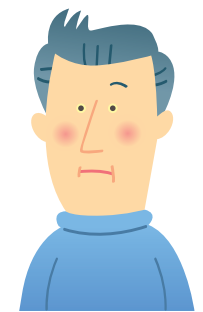
皮膚や目の色が黄色い